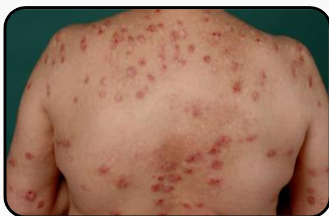
Padrão borboleta nas costas